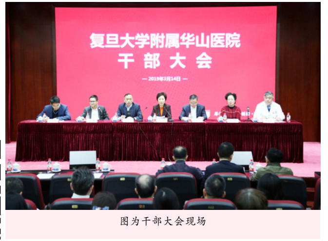
图为干部大会现场

复旦大学附属华山医院主办 第263期 本期4版 2019年3月31日 本报网址:www.huashan.org.cn