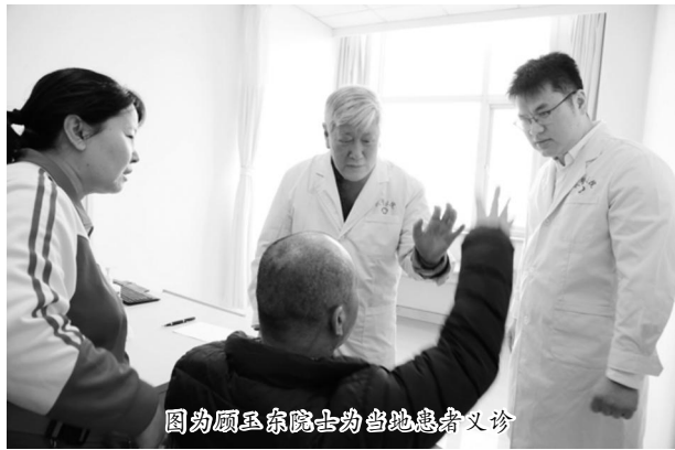
图为顾玉东院士为当地患者义诊

上海韩哲一教育扶贫基金会-顾玉东院士医教扶贫专项基金“医教扶贫中国行”首站在宁夏银川启动