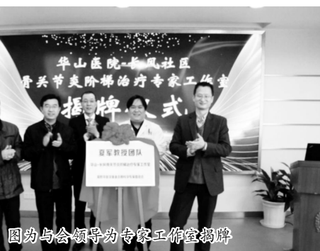
图为与会领导为专家工作室揭牌

任、韩帮来主任、叶征副主任共同为“华山医院-长风社区骨关节炎阶梯治疗专家工作室”揭牌。