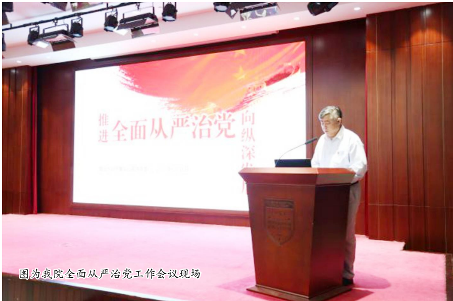
图为我院全面从严治党工作会议现场

本 报 讯 6 月 15 日 下 午，2020 年 华 山 医 院 全 面 从 严 治 党 工 作 会 议 在 门 诊 12 楼 会 议 厅 举 行。